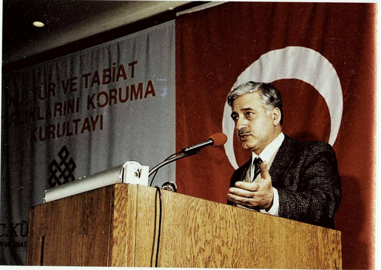
Devlet Bakanı Vehbi DİNÇERLER