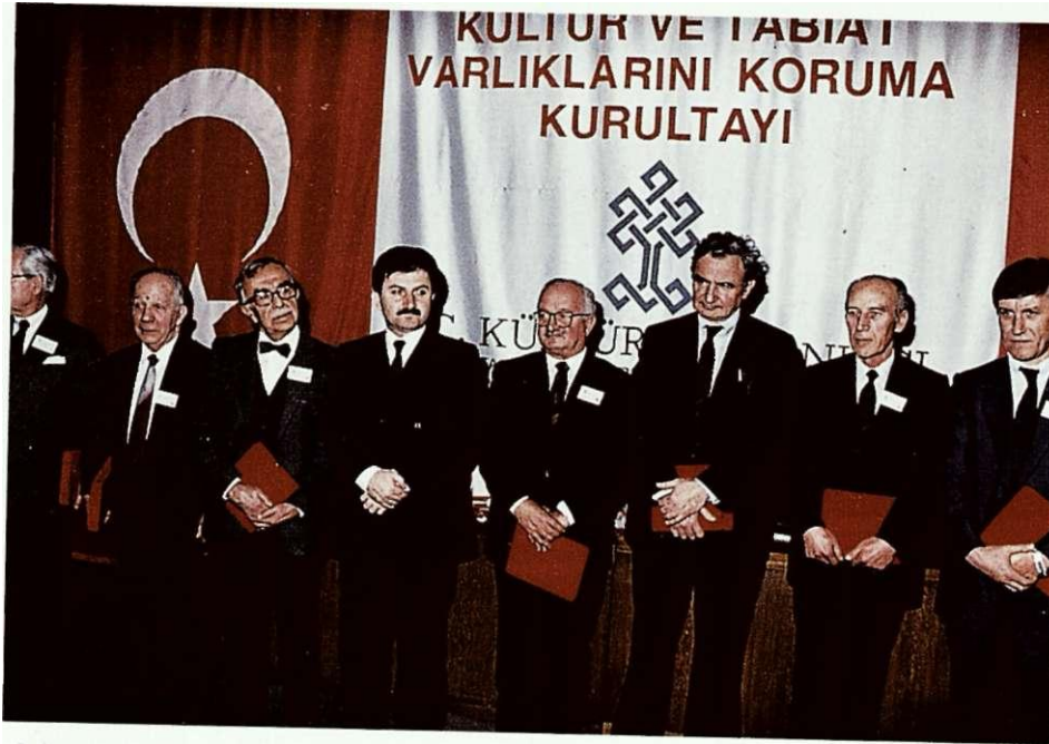
Kültür ve Tabiat Varlıklarının Korunması Konusunda Emeği Geçenler İçin Düzenlenen Ödül Töreni