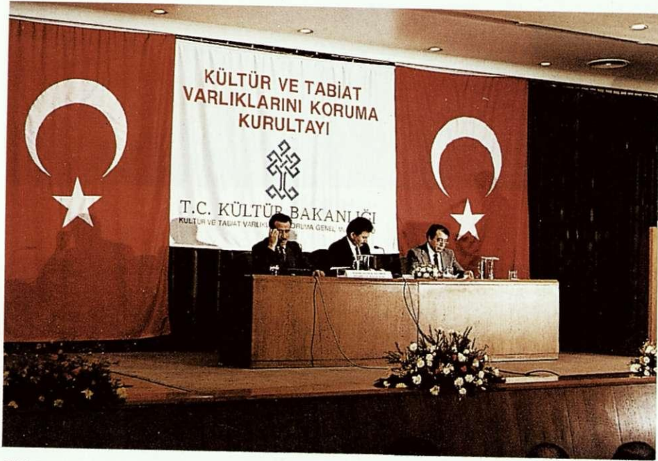
Kültür ve Tabiat Varlıklarını Koruma Kurultayı Genel Değerlendirmesi.